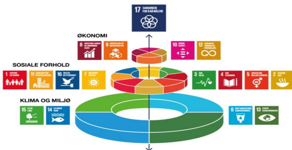
Figur 3: FNs bærekrafts mål sett i sammenheng.

Bærekraftsmålene omfatter vår tids største nasjonale og globale utfordringer. Mange av målene kan ikke nås uten lokal innsats, og det er derfor viktig at bærekrafts målene er en del grunnlaget for samfunns- og arealplanleggingen i kommunene. Kommuneplanprosessen er godt egnet for å forankre arbeidet med å realisere bærekrafts målene i lokalsamfunnet.