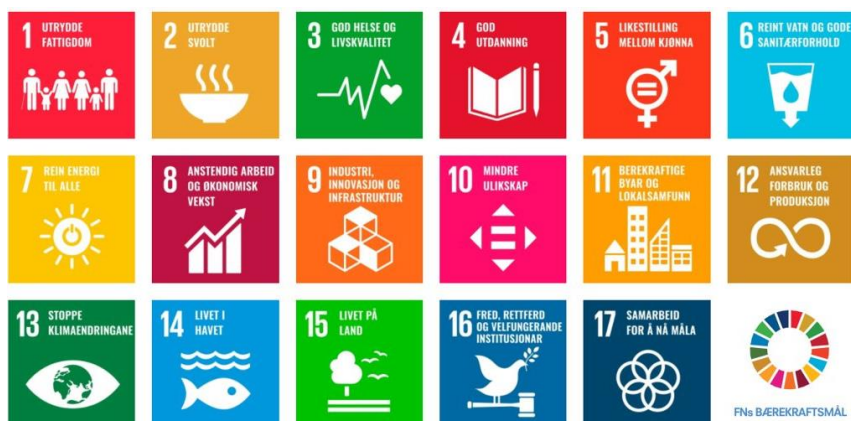
Figur 2: FNs bærekrafts mål

2030-agendaen med de 17 bærekraftsmålene som ble vedtatt av alle FNs medlemsland i 2015.