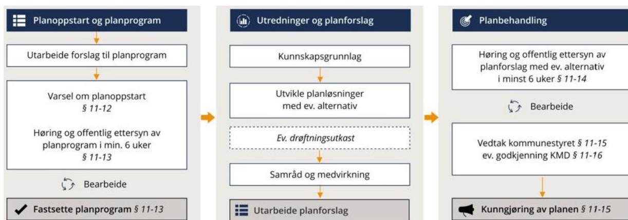
Figur 1: Prosessen ved revidering av kommuneplanens arealdel

Proessen for revidering av arealdelen foregår som vist i figuren under: