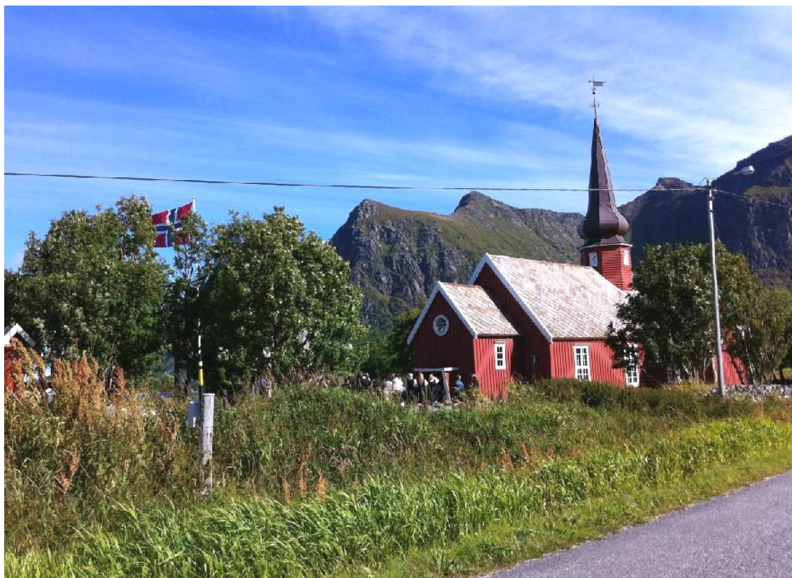
Flakstad kirke har vært en av flere testarenaer i forprosjektet.