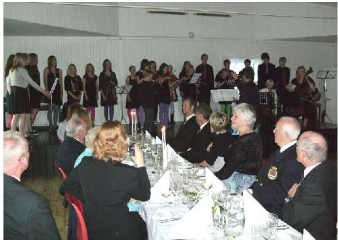
Flakstad ungdomskor og orkester underholder i selskap.

En økende cruiseturisme vil også gi muligheter for kulturbedrifter og utøvere i Flakstad, slik at kulturbasert næringsutvikling kan gi nye arbeidsplasser. Samtidig vil det kunne gi både stedsutvikling, inkludering av innflyttere og styrking av den lokale kultur og identitet. Ifølge Destination Lofoten er 82% av de besøkende kommet på ferie/fritidstur og 7 % er på kurs/konferanse. De ønsker å oppleve lokal kultur som revy, teater, sang og musikk. Andre steder i Norge har man kommet langt i å utvikle kulturtilbud og samarbeid med reiselivet. Det er viktig at opplevelsene virker autentiske og konkrete. Nordmenn har ønsket mer kultur enn utlendinger, men dette kan variere over tid.