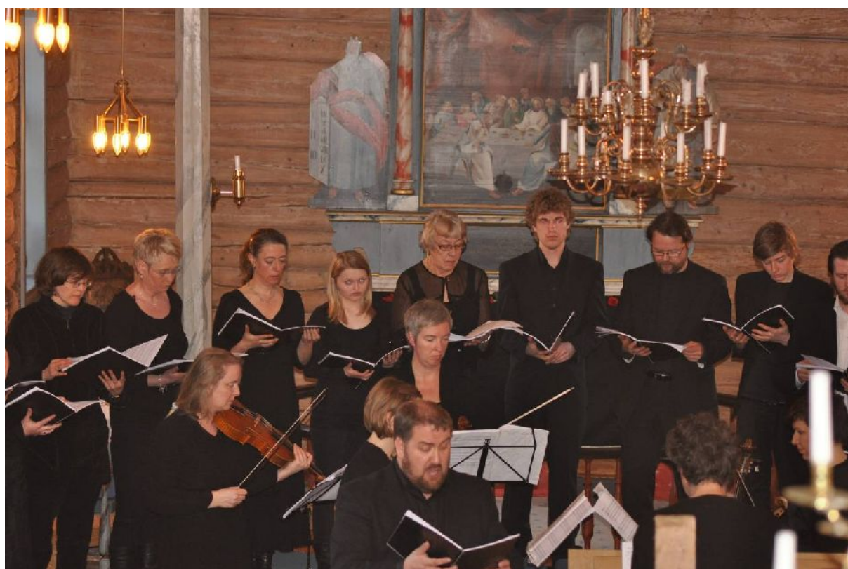
Pasjonsaften i Flakstad kirke.

SKJELFJORD UNGDOMSHUS SØNDAG 3.OKT 2010 KL. 18.00