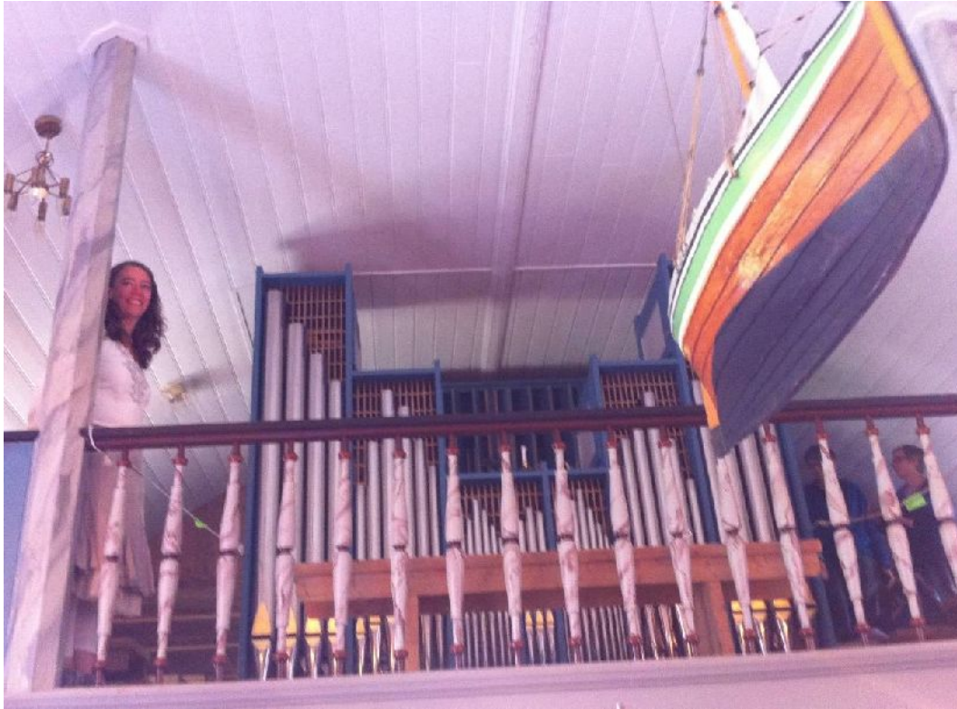
Brita, orgelet og kirkeskipet i Flakstad kirke (1780).