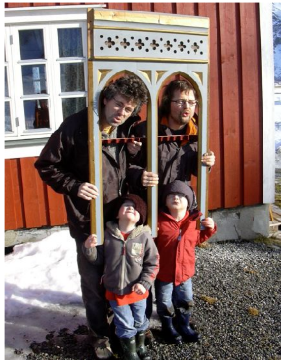
Det gamle barokkorgelet skal bidra til nytt liv i fiskerbygda Sund.